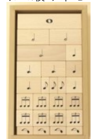
表と裏は違う音符